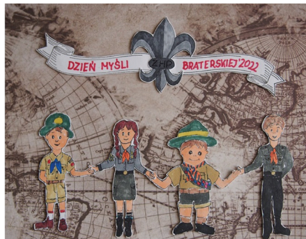
Copik Martyna – 1 RŚGZ Przyjaciele Zielonego Lasu – Hufiec Ruda Śląska