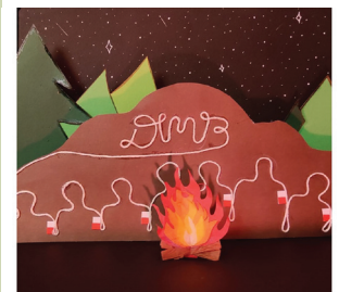
13 Ratownicza Drużyna Harcerska BRATNIE DŁONIE – Hufiec Ziemi Rybnickiej